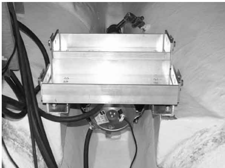
Batterihyllan monterad på gamla motorfästet. Kylfläkten som sitter monterad på motorn skymtar under hyllan.

torn som då fungerar som en generator och laddar batterierna, mera ju fortare båten seglar. Fiffigt eller hur? Farten minskar inte nämnvärt kanske några tiondels knop, har inte hunnit utvärdera det ännu.