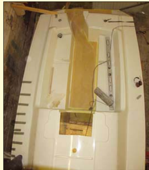
Sittbrunnen börjar bli klar